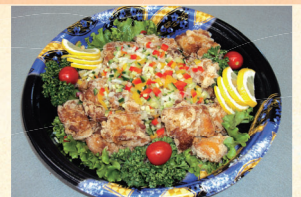
⑮ 彩りサッパリ鶏唐揚げ 4,320円(税込)