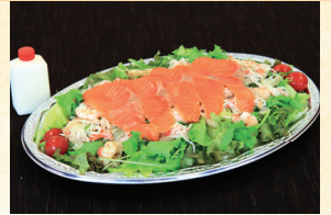
⑧ シーフードサラダ 3,780円(税込)