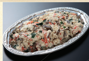
㉒ 白和え(11月~2月) 2,160円(税込)