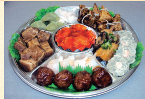
⑦ 中華オードブル 4,320円(税込)