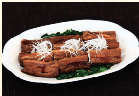
⑰ 豚角煮 4,320円(税込)