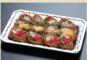
㉑ そばいなり皿 1,944円(税込)