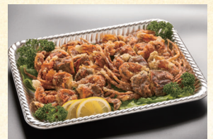
⑲ ソフトシェル唐揚げ 4,320円(税込)