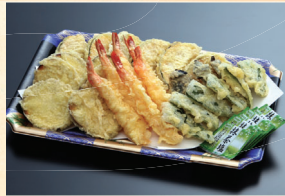
⑤ 海老入り天ぷら盛合せ 3,240円(税込)