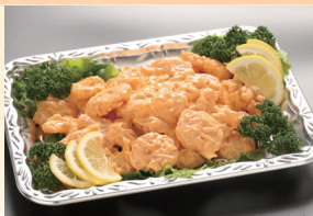
⑬ エビオーロラソース 4,320円(税込)