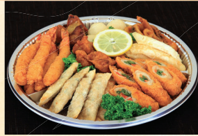
⑥ 揚物オードブル 4,320円(税込)