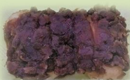
あんころ餅2個入り