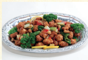
⑯ 鶏肉のカシューナッツ炒め 4,320円(税込)