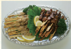
⑩ 焼き鳥オードブル 3,240円(税込)