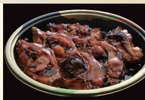
⑳ 煮鯉切身(6切) 3,888円(税込)