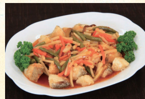
⑱ 白身魚唐揚げ野菜あんかけ 3,780円(税込)