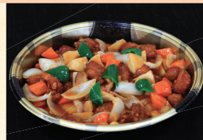
⑭ 酢豚 4,320円(税込)