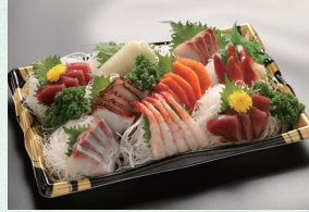
② 刺身盛合せ 4,860円(税込)