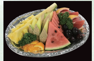
⑫ フルーツ盛合せ 2,700円(税込)