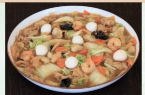
⑯ 八宝菜 4,320円(税込)