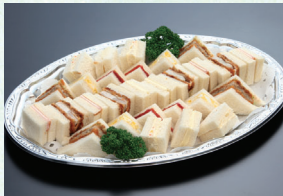
⑨ サンドイッチ 2,700円(税込)