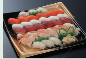
③ 生寿司 5,400円(税込)