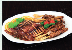
⑪ 焼き鳥&いか焼き皿 3,240円(税込)