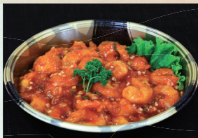
⑬ エビチリソース煮 4,320円(税込)