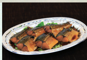
㉒ さば煮付け(6切) 1,944円(税込)