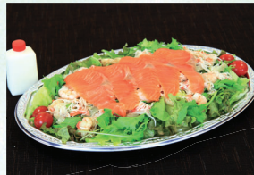
⑩ シーフードサラダ 3,780円(税込)