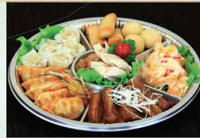
⑦ 中華オードブル 4,320円(税込)