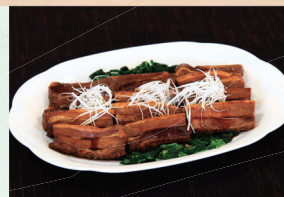
⑮ 豚角煮 4,320円(税込)