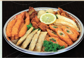
⑥ 揚物オードブル 4,320円(税込)