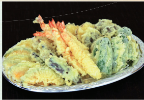
⑤ 海老入り天ぷら盛合せ 3,240円(税込)