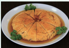
⑰ かに玉 4,320円(税込)