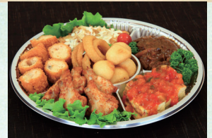
⑧ 洋風オードブル 4,320円(税込)