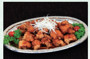
⑳ 鶏南蛮揚げ 3,240円(税込)