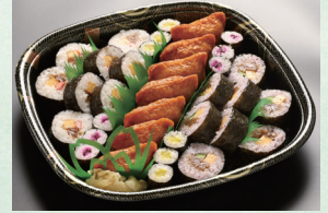
④ 巻・いなり寿司 3,240円(税込) (いなり抜きもできます。)