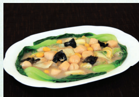
⑱ ホタテ貝柱と白菜の煮込み 4,860円(税込)