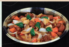
⑭ 酢豚 4,320円(税込)