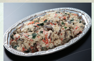
㉔ 白和え(11月~2月) 2,160円(税込)