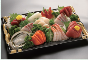
① 刺身盛合せ 6,480円(税込)