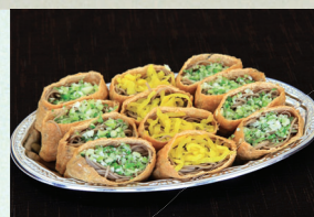
㉓ そばいなり皿 1,944円(税込)