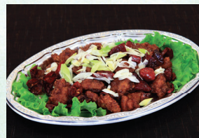
⑲ 四川唐辛子と鶏肉のピリ辛炒め 4,320円(税込)